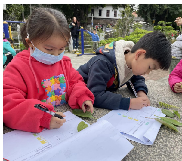
（西桥社区关工委 关浩淳）