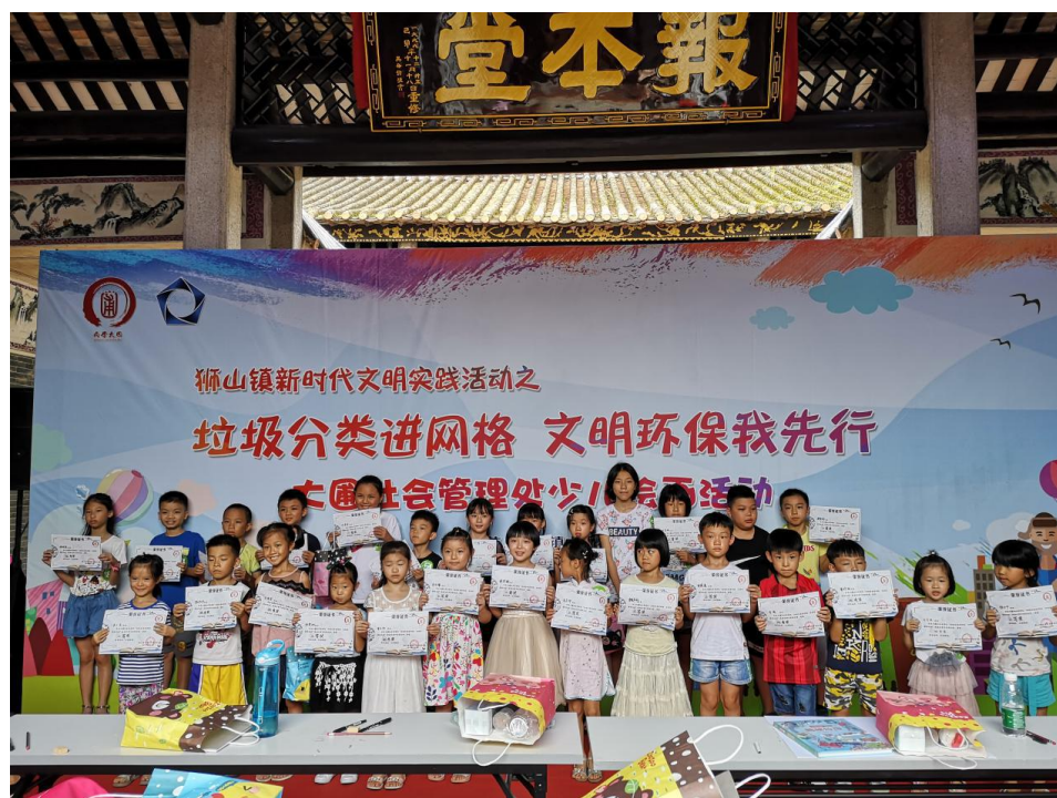
一批“小艺术家”和“环保小达人”诞生。