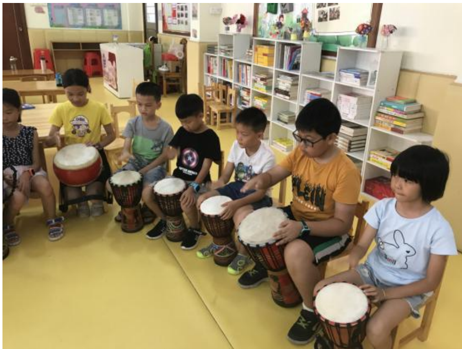
小朋友在学打非洲鼓

N03 水南社区 关工委的小候鸟驿站7月中下旬，共开展“爱相伴·心相连”亲子活动共17场，有505人次参加，受到广大家长、青少年学生及社会的一致好评。