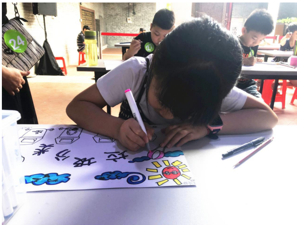
图：小画家们埋头创作。

经过一个小时的创作，蓝色星球、绿色植物、美丽家园跃然纸上。随后还开展了“环保小课堂”和“环保小达人”游戏，传播垃圾分类的知识和绿色环保低碳的生活理念。通过专业评委的审定，一批小画家和环保小达人诞生。