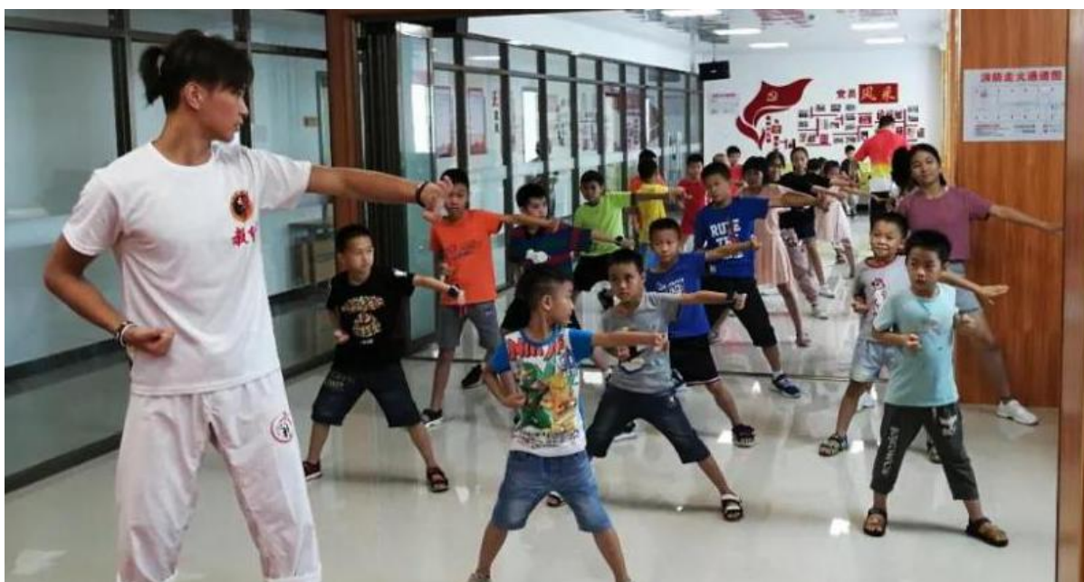
小朋友表演起《少儿咏春》有模有样