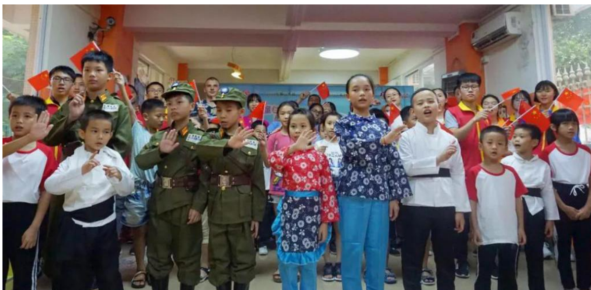
狮山大圃的孩子们在表演红色情景剧《少年入党 奋身革命》

※7月22日到8月中旬，大圃关工委开展的“童心追梦 尚美大圃”暑期系列活，共提供约400个服务名额给辖区内小候鸟及本地儿童参与。在启动仪式上，小朋友、志愿者齐聚长虹岭聚心园小候鸟驿站大本营，带来红色情景剧《少年入党 奋身革命》，孩子们铿锵有力的革命宣言，精彩的情节演绎，赢得了阵阵掌声；《少儿咏春》中小念头、进退马、冲拳稳而有力。