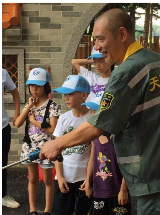
孩子们跟着环卫工人初步认识垃圾分类